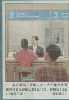
銀行業為了爭奪人才，大企業今年普遍將見習生月薪調上調至10%，薪酬由1.2至1.7萬不等。(資料圖片)