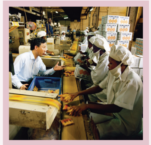
在尼日利亞的生產工場

據中國新華通訊社的報道，去年中非之間的貿易額達到了2,100億美元，有2,500餘家中國公司進軍非洲。然而，中國公司在非洲正面臨文化、政治、結構性，以及勞工方面的大量問題。在中國渴望大舉擴張在非洲商業版圖之際，許多中國公司都希望在這樣一個歷史性時期儘量把握當前的機遇，但現有的非洲工商資料匱乏，難以協助中國公司進入非洲市場。針對這種情況，陳淑賢(2013 DBA學生) 研究如何在尼日利亞經商，梁日昌(2014 DBA學生) 則計劃給那些願意到埃塞俄比亞尋找機會的中國公司提供建議。