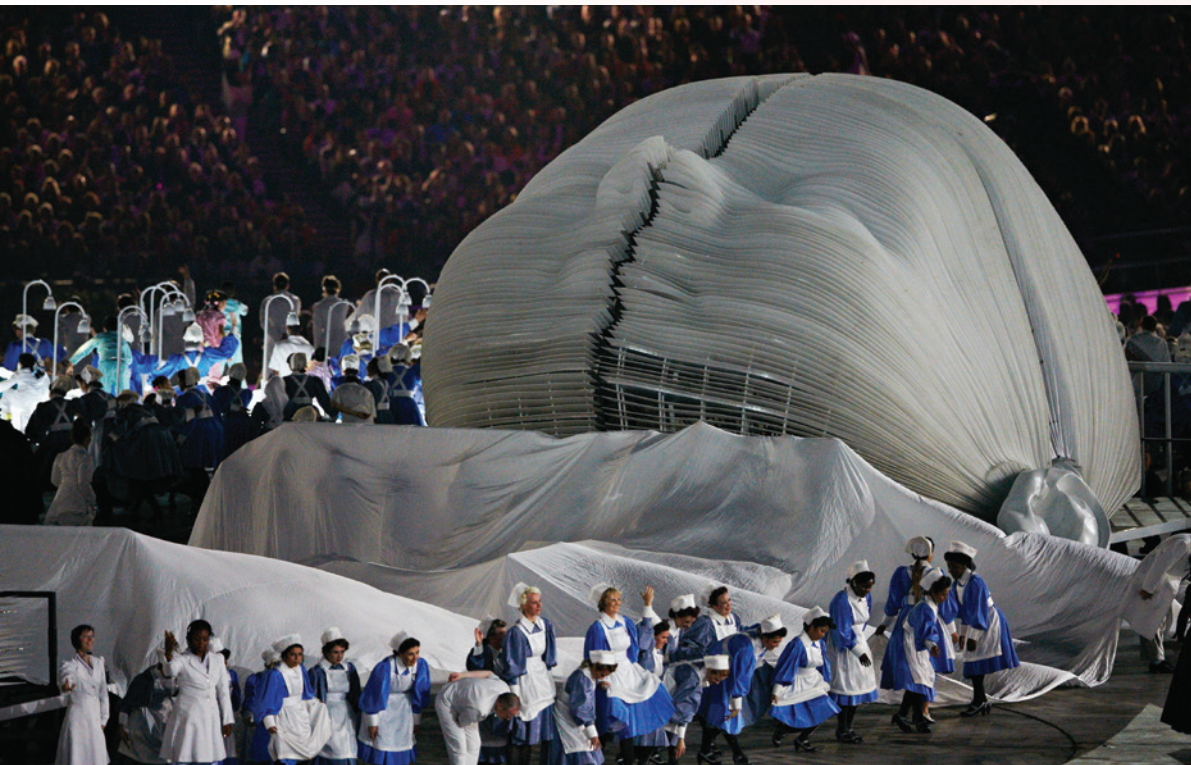
2012年倫敦奧運會開幕式頌揚大奧蒙德街兒童醫院，這所醫院是英國國民醫療服務的一部分。

基於多方面的因素，香港的醫療服務正處於新紀元來臨的轉捩點。「提供21世紀的醫療服務」項目正好應運而生，它的研究領域包括醫院資源的規劃及管理、公私營合作、患者診治的流程管理、醫療服務數據的多維挖掘、風險調節措施等。這個雄心勃勃的研究項目，承襲了商學院應用研究項目一貫以改善社會民生為宗旨的傳統，正着眼於為香港醫療服務的提升做出具有深遠意義的貢獻。 ■