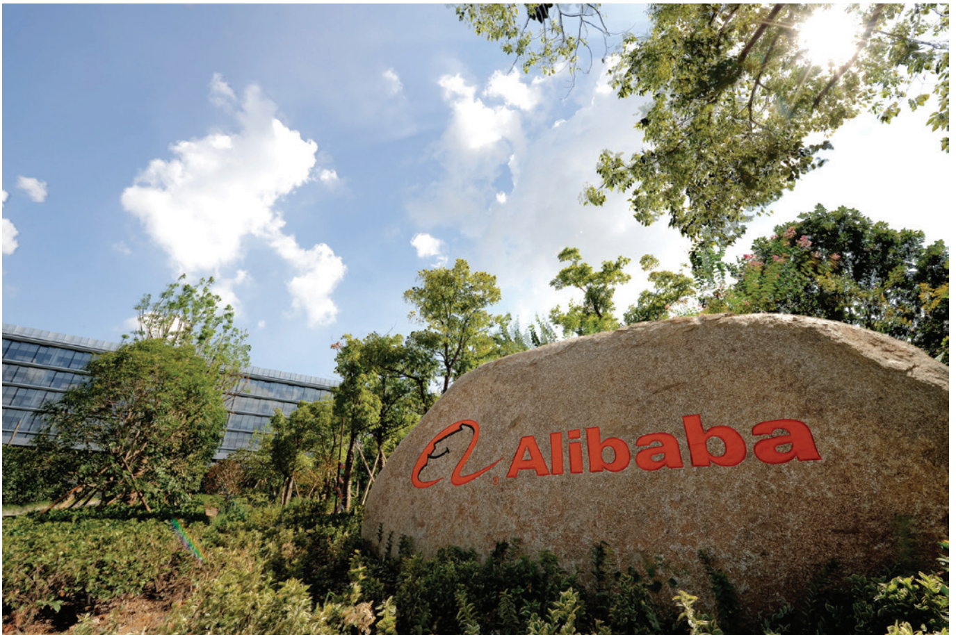
阿里巴巴集團位於中國杭州的總部

這麼多精英回到本土會帶來怎樣的影響，只有歷史才知道。有一點似乎可以肯定的是阿里巴巴IPO已掀起了巨大影響。 ■