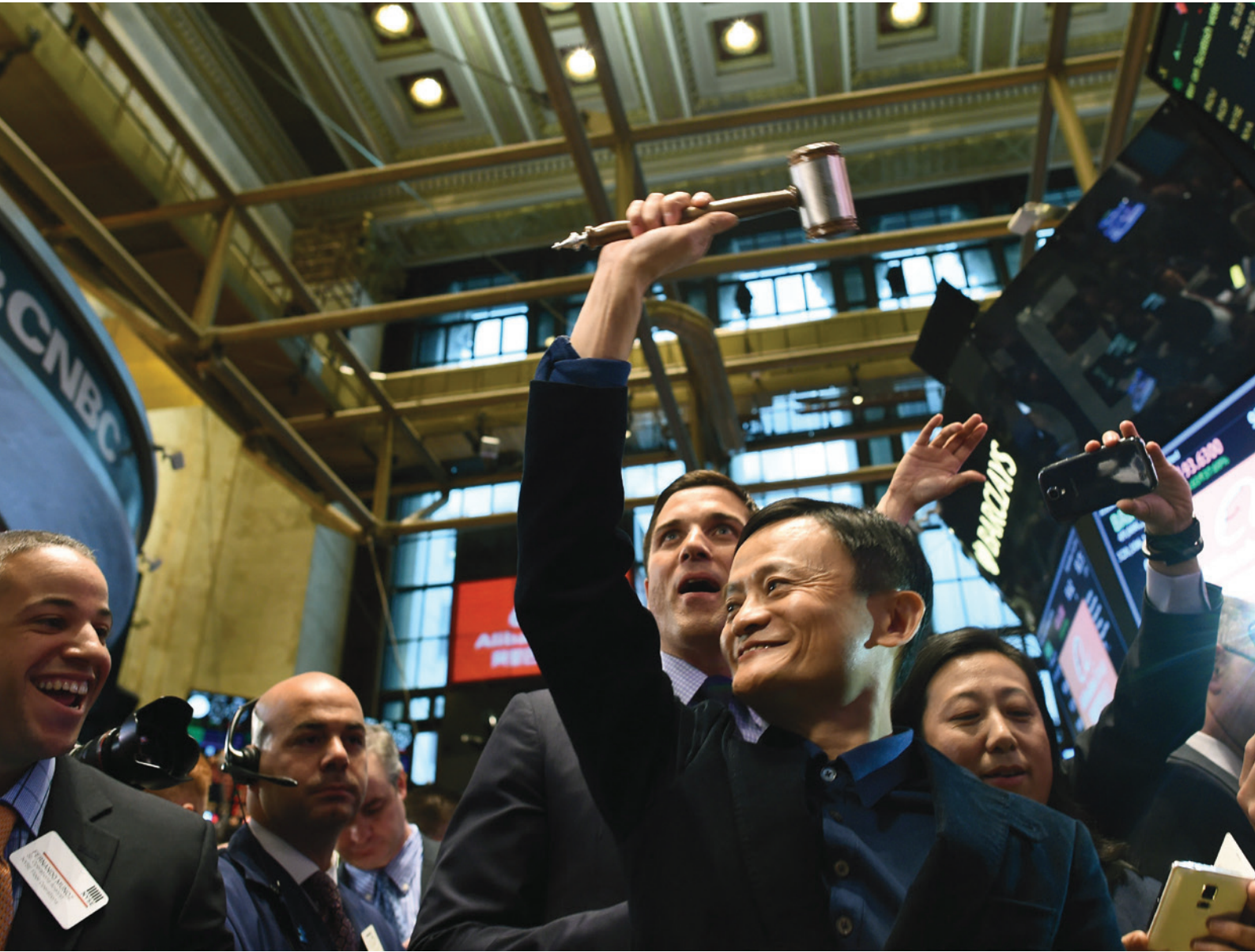
阿里巴巴集團執行主席馬雲先生

中國企業正準備在創新之路上發揮更大的領導作用，這對於他們選擇在何地上市也有一定程度的影響。