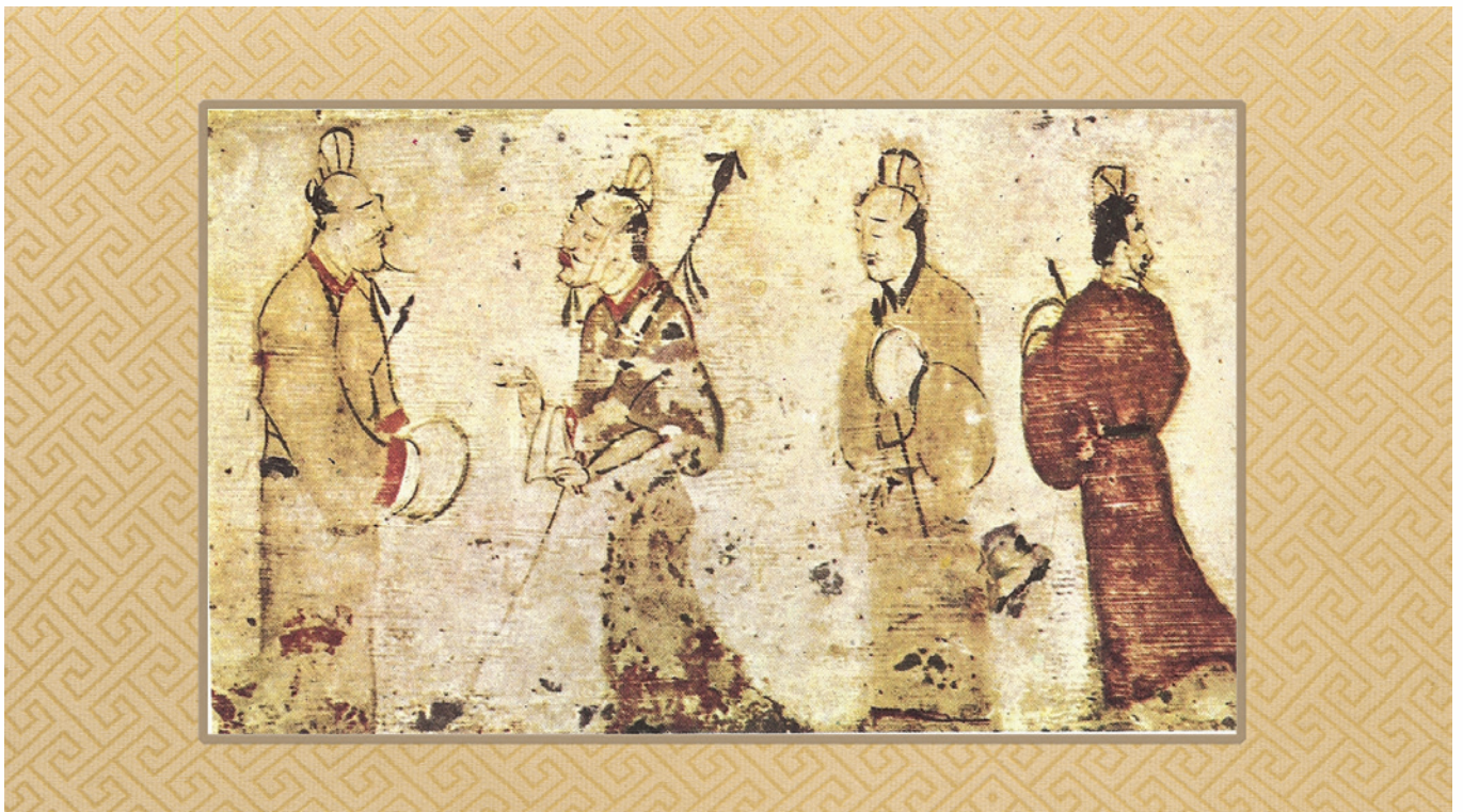
東漢畫作《交際中的仕紳》

這些看法和爭論在今天，無需專家學者，一般市民也能侃侃而談，但在兩千年前，卻體現出相當深入的思考。