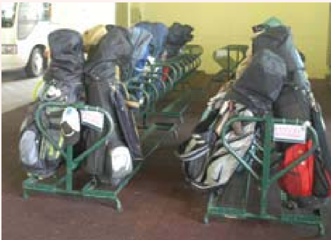
The golf equipment

On 28 March 2009, a group of 28 students participated in the Golf Introduction Day organised by the Department. The students gathered at the Sai Kong Public Pier and took a ferry to the Kau Sai Chau Public Golf Course.