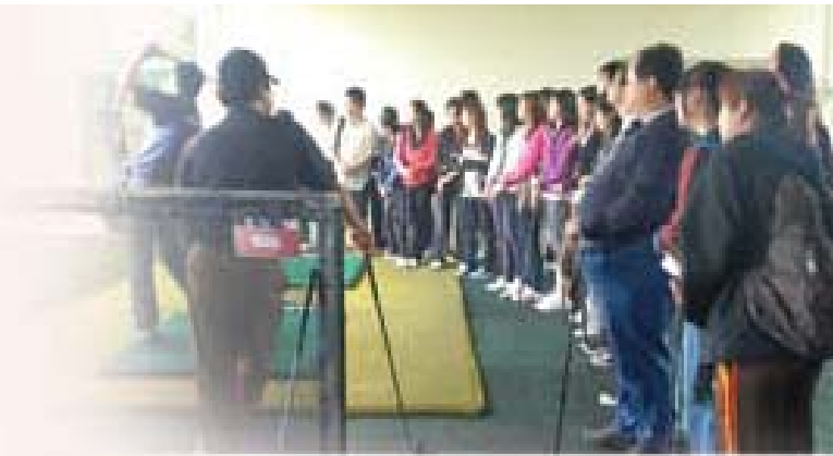
Students listening carefully to the introduction by the coach

At the course, the coach gave a brief introduction to golf, including the terminology, equipment, safety precautions and proper etiquette. He also taught the students some fundamental skills like stance, address, back swing, down swing and how to follow through after each stroke. The students then practiced with a No. 7 iron for an hour, before going for a lunch buffet.