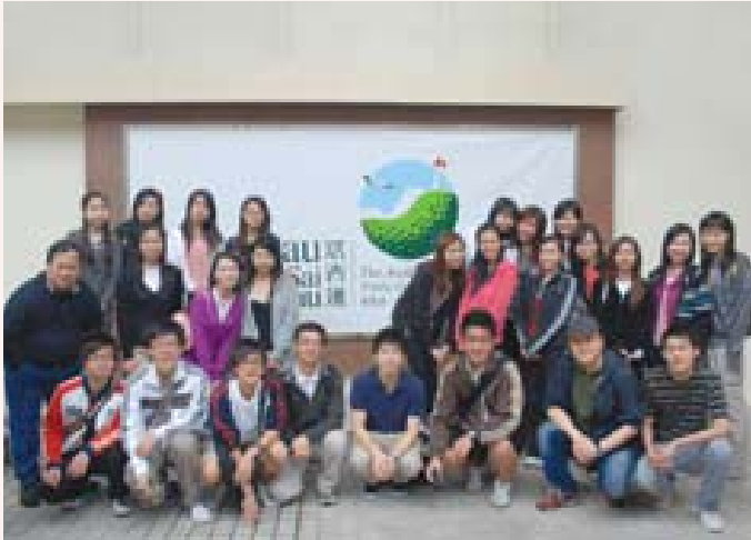
A group of cheerful students ready to take their exciting golf course